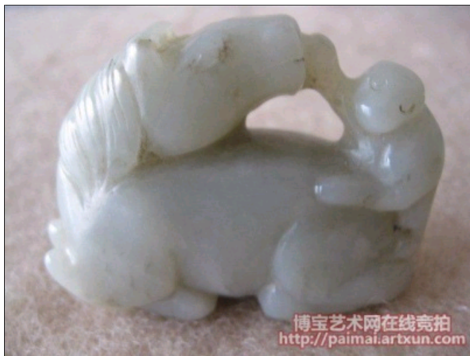
清代和田玉马上封侯