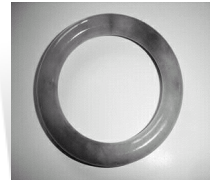
和大家一起分享祖