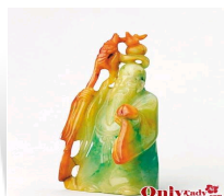
东方绿宝石翡翠的