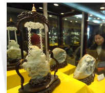
第三届中国玉石雕