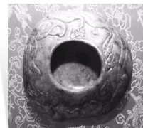
清代玉石笔洗酷似