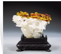
寿山石雕名家精品