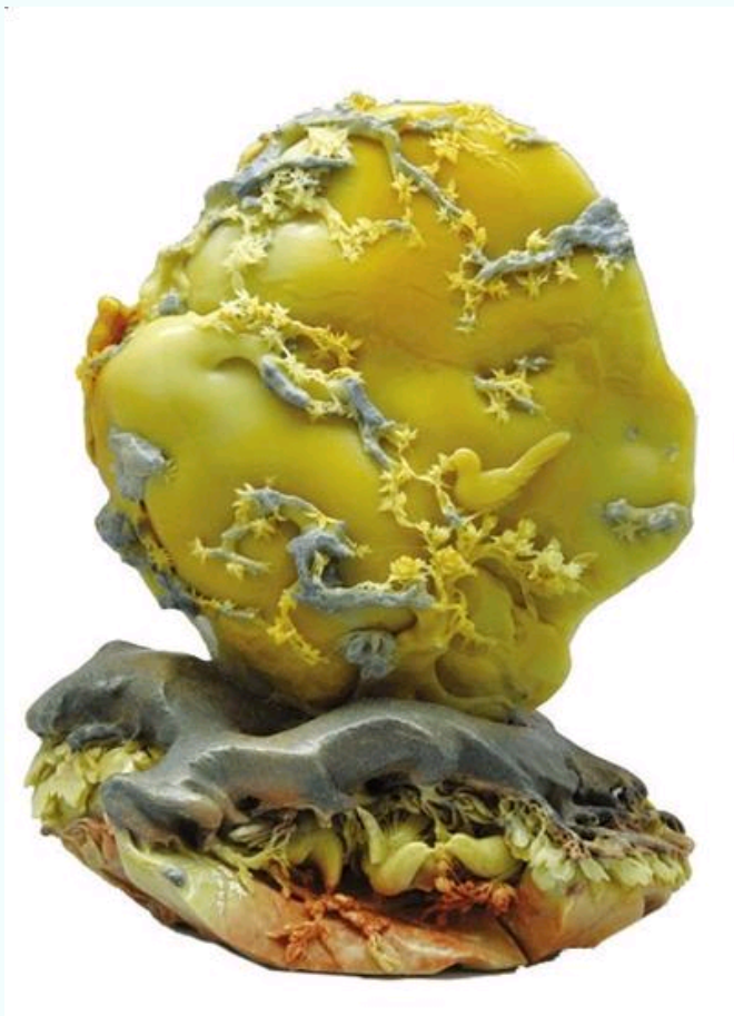
张爱光青田雕件《金晖》60万元