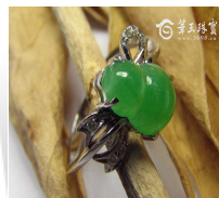
典雅葫芦翡翠戒指