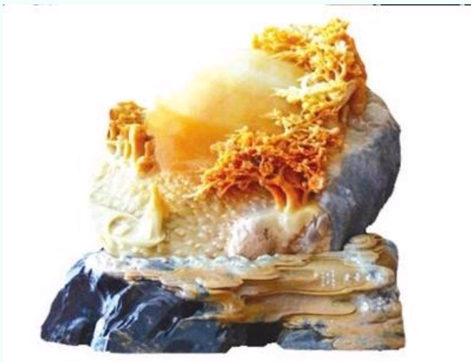
陈小甫青田石雕件《胜日寻芳》30万元