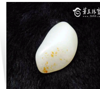
白润喜人黄皮和田