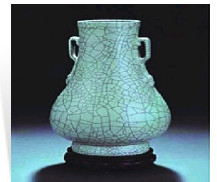
瓷器杂项仍是匡时