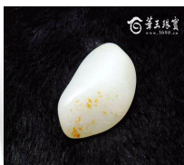
白润喜人黄皮和田