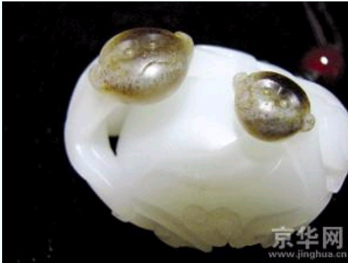
俏色籽料作品“伶猴献寿”