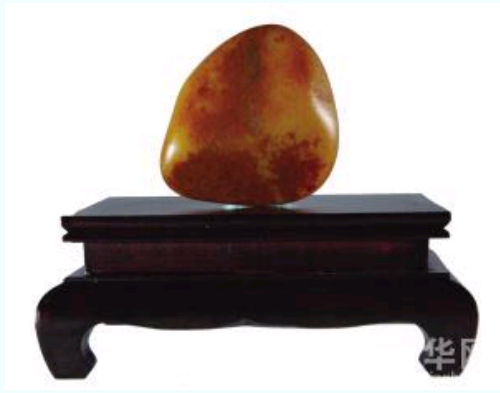
和田籽玉原料“黄金甲”（图二）