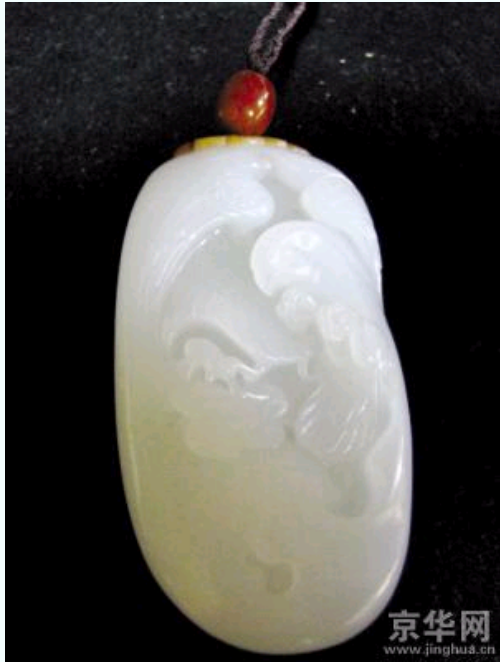
和田籽料作品“英姿”（图三）