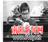
从玉盲到行业新秀