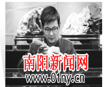
从玉育到行业新秀