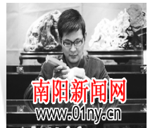
从玉盲到行业新秀