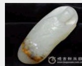
白玉籽玉-平安如意观 价格: 16500 元