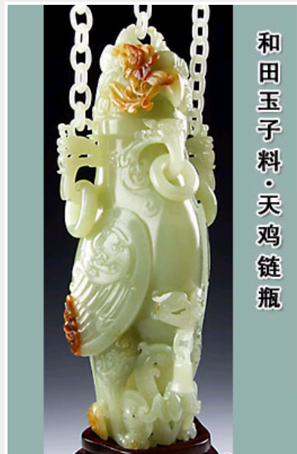
和田玉籽料·天鸡链瓶