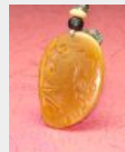
和田玉黄玉籽料 价格: 39000 元