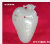
籽玉: 貔貅 价格: 11000 元