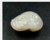
和田玉籽料如意挂件 价格: 7200 元