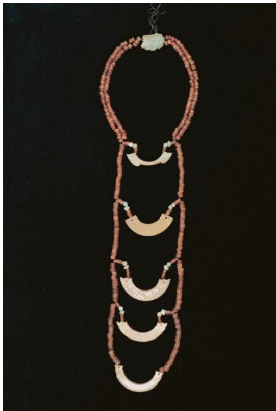
虢季夫人墓五璜联珠组玉佩