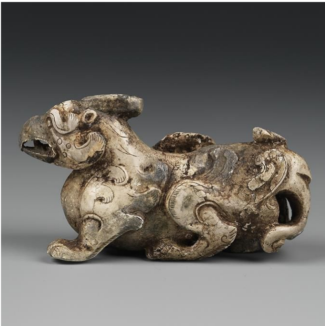
( http://reserve.auroramuseum.cn/uploads/20141216/77864d66 ( http://reserve.auroramuseum.cn/uploads/20141216/187c9037-5557-4dba-bf8e-e4e1374dc6ed.jpg )

馆藏玉器上迄新石器时代下至明清时期，时间跨越整个中国古代历史，囊括不同区域诸多精品，在展现历代玉器鲜明艺术风格的同时，揭示着数千年来中华玉文化的流变与积淀。