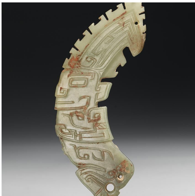
新石器时代 红山文化 兽形饰