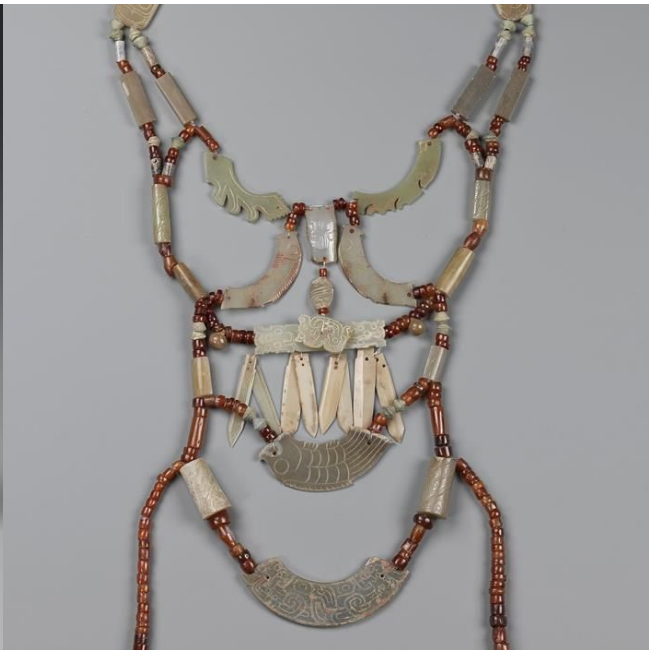
( http://reserve.auroramuseum.cn/uploads/20141216/187c9037-fc0e-4825-8e90-9c45fb1e0ec8.jpg )