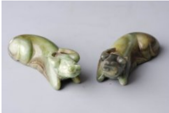
名称：清青玉卧牛 尺寸：长9厘米,宽3.3厘米 时代：清代 水牛一对，仰头登眼大弯角，四足前跪。玉质晶莹。