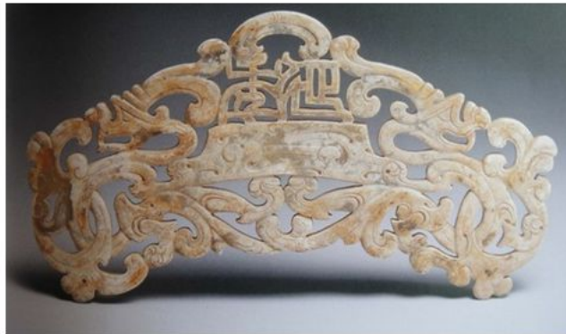
图13 震旦艺术博物馆收藏

2、龙首写实。西汉晚期以前的侧面龙首，图腾意味较浓，更多是追求神似，重视具象不够。琢刻时突出重点，注重并夸大五官中的眼、鼻、口的特征，渲染神秘、威严的气氛。水滴眼无瞳仁居多，上唇一般为单层上卷，只琢刻獠牙，无其余牙齿，额为尖额居多，下颌有的有须、有的无须，但有须的刻画并不细致，多为笼统的一撮，并无毛发细节修饰（见图14、15、16）。而西汉晚期至东汉，龙首的雕刻进一步向神形兼备的方向发展，发生了一些细节上的变化，特别是出现了一些新的纹饰元素，比如扉棱状的牙齿。如果说西汉晚期以前的龙首还较为简单、抽象的话，那么这之后的龙首则更为写实、具体，更像一只“真实”的动物（见图17）。该璜龙首为侧视角度写实造型，眼有瞳仁，上唇为双层上卷（唇边还琢短平行阴线纹和圆圈纹），头上所琢单角，已从西汉之前常常耳、角不分的状态向龙角突出、醒目迈进了一大步。口开得很深，这种大张口是汉代玉龙的重要造型特征，也是唐代龙纹口角大开口形的雏形 ⑧ 。口内的扉棱状牙齿还有细节刻画，为了区分每颗牙齿，在扉棱上琢刻两道阴线，并纵向打凹（这个部位的打凹难度极大），形成单颗牙，工艺相当讲究。球形圆额与一些动物、特别是禽类的凸出前额相似。下颌的须髯用阴线雕刻，一丝不苟，极具毛发的质感。这些纹饰上细微的、写实性的变化，为我们断代提供了许多重要线索。