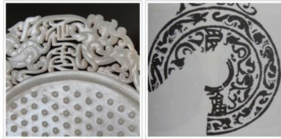
图11 咸阳市周陵乡新庄村出土