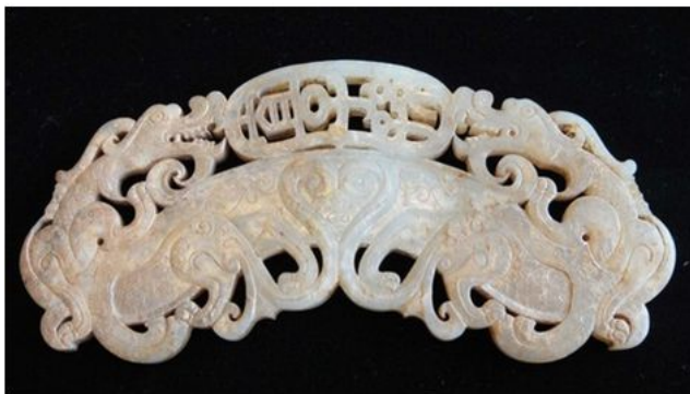
图1 崇玉堂珍藏长15.7厘米，宽7.6厘米，厚0.6厘米

笔者以传世品双龙纹“宜子孙”璜（见图1）的纹饰为切入点，比对馆藏出土玉器，从而研究、剖析东汉玉器的纹饰特点，以期寻求并找到一些断代性、规律性的认识，为民间东汉玉器的鉴定提出己见，供收藏爱好者参考。