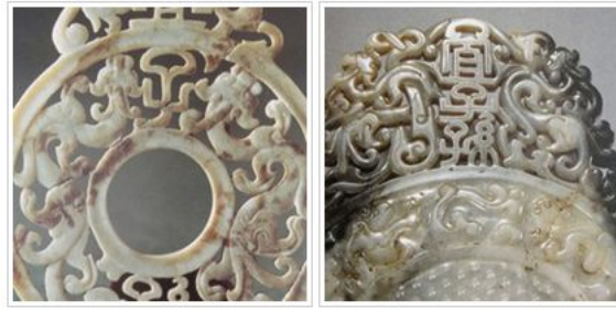
图7 江苏省扬州市甘泉老虎墩出土