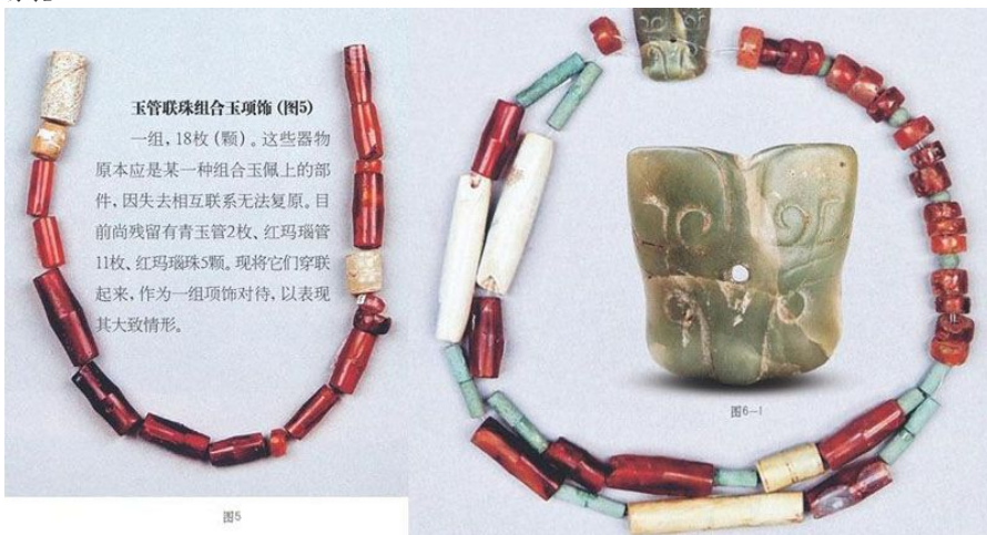
玉管联珠组合玉项饰 (图5)

图2-3, 长6.4厘米, 宽2.7厘米, 厚0.2厘米。位于组玉佩内圈下端中央。青玉。冰青色, 器内散布零星黑色炭渣颗粒状物。润泽光洁, 透明度甚好。鱼身作璜形弯曲, 双面片雕。弓背, 翘唇, 口下方似有一爪, 中部分叉的尾鳍各向两边外张开, 背鳍与腹鳍以阴刻细若发丝的成组并行线表示。与其他鱼形佩稍有不同的是, 此鱼的腹鳍与背鳍一样, 都是单鳍。鱼的口端与内侧尾鳍上各有一个圆形小穿孔。