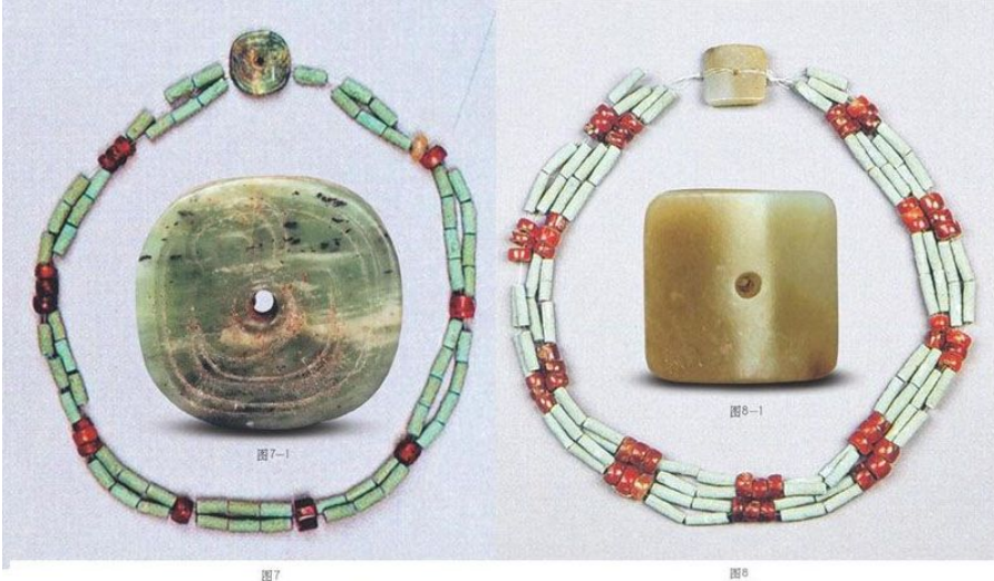
单佩联珠组合玉项饰（图7）

图6-1，高2.2厘米，上端宽2.1厘米，下端宽1.8厘米，厚0.7厘米。青玉。深豆青色，略泛青绿色，有两道黄白色纹理沁斑。微透明。其外轮廓略呈梯形，中心有一圆形小穿孔。正面呈弧形凸起，饰兽面形纹样；背面平素，四周边棱被磨得较为光滑。兽面头上有桃形双耳，鼻部呈缓状凸起，粗眉上挑，圆睛略微向外凸出。