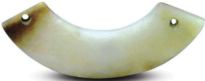
战国·双孔玉璜 长10.2厘米 宽2.5厘米 厚0.4厘米

春天给人的印象总是那么美好，桃红柳绿，莺歌燕舞，千山滴翠，阳光明媚，合肥的春天亦是格外的美丽，润心如玉。一场大型传世古玉器展销，自春节即在安徽省文物总店二楼大厅举办，数百件传世古玉器琳琅满目，绚丽多彩，也似与这春之美景琴瑟相和，醉人心脾。据考古资料所知，所谓“传世古玉器”绝大多数是历史上古墓葬和古遗址出土。即使是时代较晚的明清时期的玉器，也有一部分出土于墓葬之中。在这次展销中，有200余件玉器精品，都是经过多位专家鉴定，年代自新石器至清代各个时期，有的属国宝级文物。这里选拍部分古玉精品供读者鉴赏。