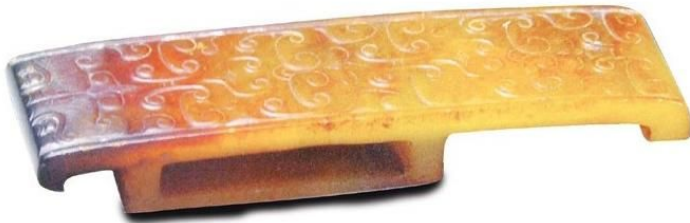
汉代·玉兽面纹剑璏 长9.6厘米 宽2.6厘米 厚1.3厘米

璜，古玉石器名，形状像璧的一半。古代贵族朝聘、祭祀、丧葬时所用的礼器，也作装饰用，商周墓葬中常有发现。这件战国时代的玉璜，系用优质青白玉雕琢，质地坚硬，温润光泽。半圆形，扁平体，通体光素无纹，两端平直，各钻有一圆孔，有黄土沁色。从古代墓葬中出土的玉器，表面多带沁色，那是因为长期埋于土中受腐蚀所致。此件二千年前玉璜，打磨光亮，形制古朴，品相完好，十分难得。