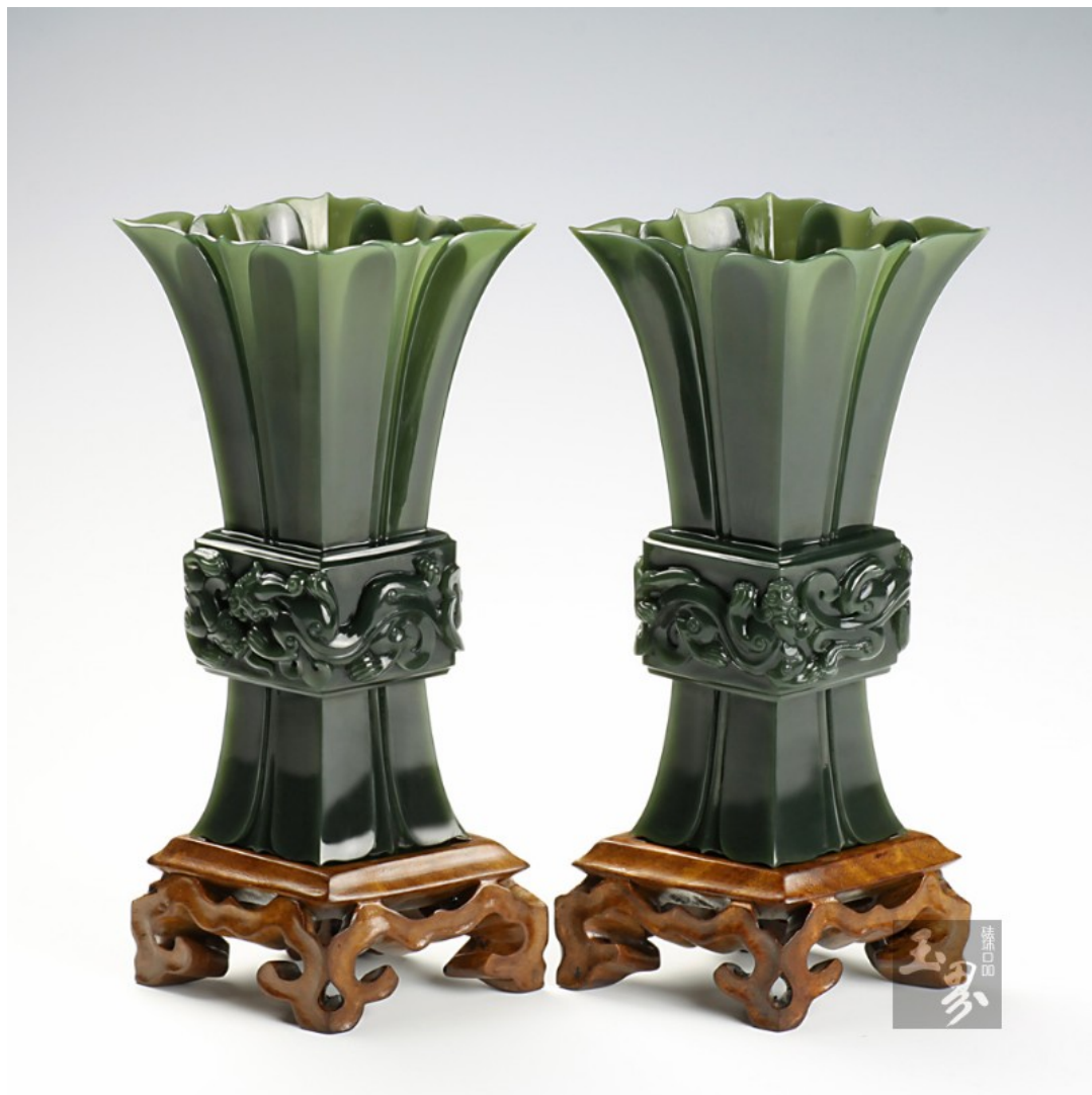
青玉-莲瓣花觚（对）（玉界臻品）

和田玉与翡翠到底哪个是玉中之王还是要看“什么是玉”这个基本问题的。目前学术界分为两派，一派是玉石、宝石合一派，以宝石学为衣钵，目前占“统治地位”；另一派是宝石、玉石区分派，材料性质不同、文化传统不同，应该由宝石学和玉石学分别构建。“合一派”当然以宝石的评价标准来看待玉石，以色彩、纯净度为主导，透明度和硬度也很重要。在这个标准下和田玉确实不如翡翠了。同时宝石用途以首饰为载体，整个宝玉石行业也是“珠宝玉石的首饰行业协会”，加上近来翡翠的价格更加高涨，这样翡翠作为玉中之王也就顺理成章了。