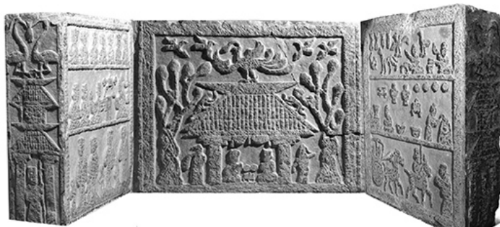
图一 铜山汉王乡东沿村祠堂