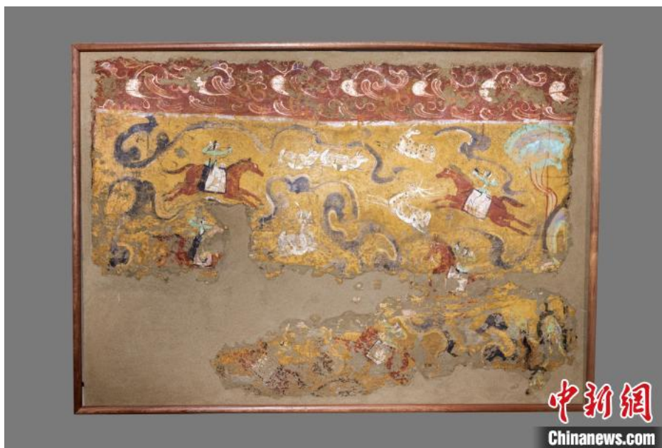
图为展出的汉墓壁画围猎图

这些珍贵的汉墓壁画多具有有现实主义和写实风格，包括反映当时人们生活面貌的农耕图、车马出行图、围猎图、歌舞楼阁图等，既富有中原文化气息，又极具少数民族特色。