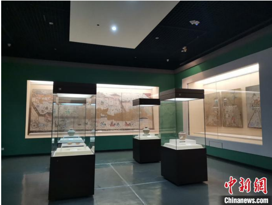
北方草原汉墓壁画珍品展在洛阳博物馆开展

中新网洛阳5月18日电 (记者 韩章云)5月18日，洛阳博物馆与鄂尔多斯青铜器博物馆、鄂尔多斯博物馆合作举办的《草长鹰飞——北方草原汉墓壁画珍品展》在洛阳博物馆开展，与公众见面。这也是今年国际博物馆日，洛阳博物馆推出的重磅展览。