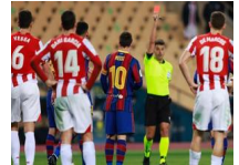
梅西领巴萨首张红牌