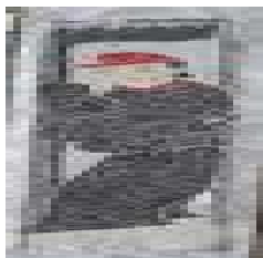
南阳市汉画馆未公开展出