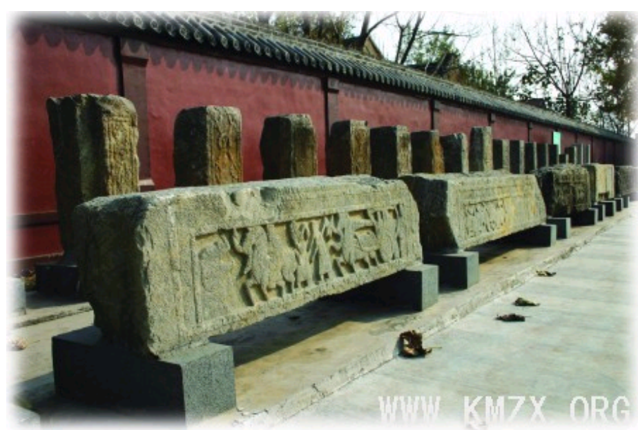
北寨汉墓中出土的汉画像石

画像石所绘题材广泛，内容有攻战、祭祀、出行、宴享、乐舞百戏、历史故事、神话人物、奇禽异兽等，涉及社会经济、政治状况、阶级差别、民族关系、哲学宗教、神话传说、历史故事以及典章制度、建筑风格、风俗人情等诸多方面，为考证东汉末年的社会经济状况、阶级矛盾、典章制度、风俗人情、建筑发展、绘画风格、宗教哲学思想等提供了宝贵的资料。