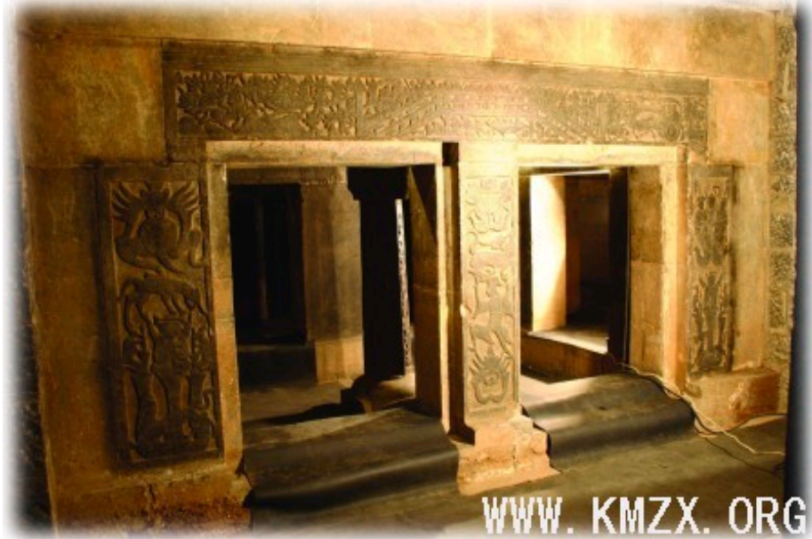
一号墓中布满了精美的画像