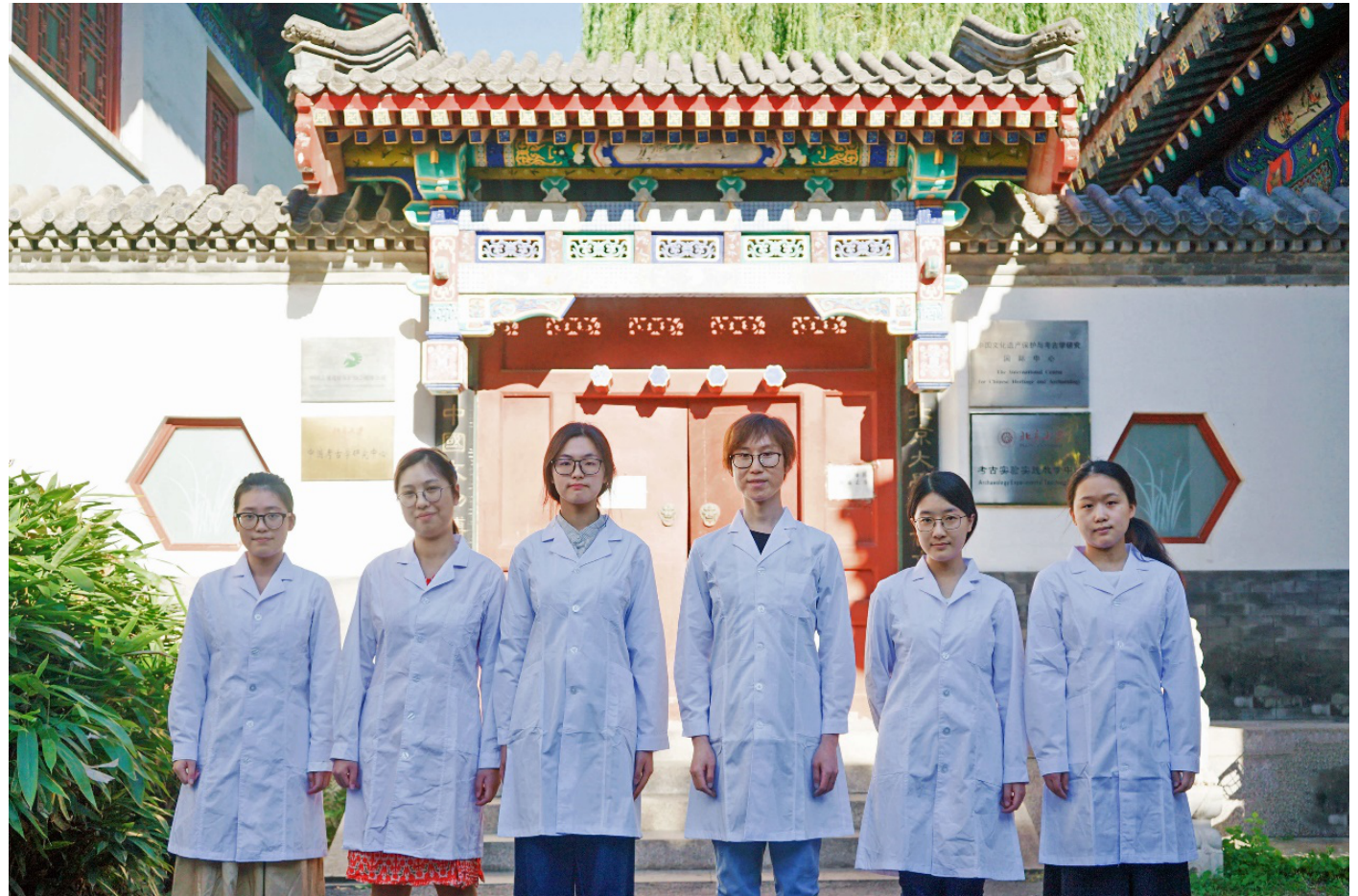
参加本次实习的师生