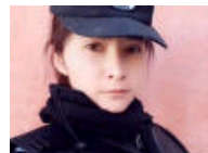
新疆美女民警走红