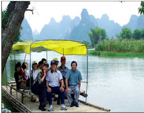
隆林天生桥天湖风光