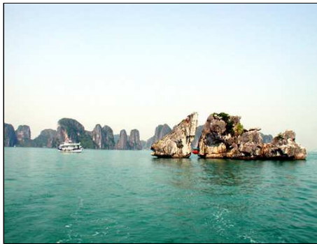
越南下龙湾海上石林风光

透过这十大旅游精品，不难看出十大精品实际上是广西旅游的十大特色产品、十大品牌、十大拳头产品，这正如十道菜，每道有每道的口味，每道都令人回味无穷。游览每个精品都会给旅游者带来不同的人生感受，旅游者的体验是深刻和令人难忘的，这就是十大旅游精品的价值所在。