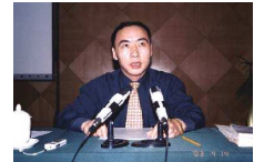
提升广西旅游产品竞争