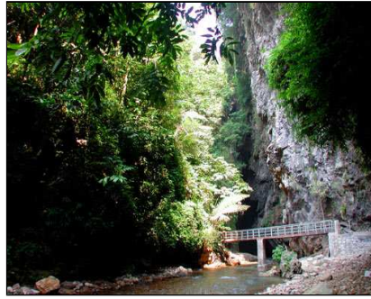
幽深的靖西通灵大峡谷