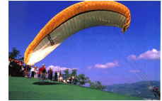
特色旅游：21世纪旅游