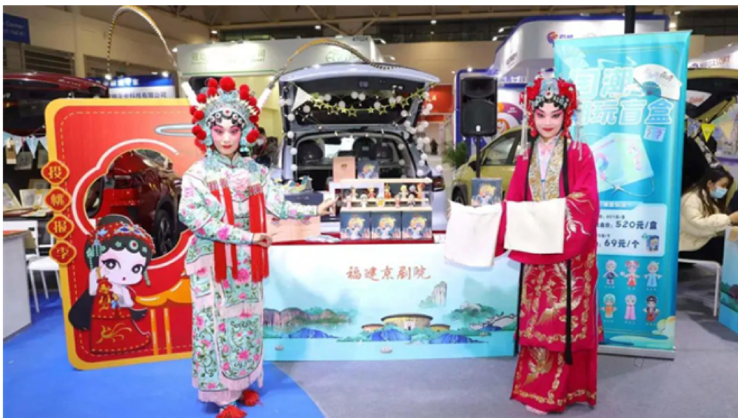
文创产品展示

其中, “福见·山海画廊”展区重点展示“1号滨海风景道”“武夷山国家森林公园风景道”沿线市县的文化和旅游资源、产品, 推介“八闽有福·冬日游礼”文化和旅游精品线路。“福潮·琳琅荟萃”展区围绕传统民俗、非遗体验、特色美食等主题, 举办“福潮市集”, 按照福味、福艺、福韵、福饰、福器、福礼、福趣、福品等八大类别, 展示近千件文创产品。“福礼·特惠直播”清新福建文旅产品专场直播带货活动也同期启动, 优选了福建茶、建盏、德化白瓷等商品在抖音平台进行直播销售。