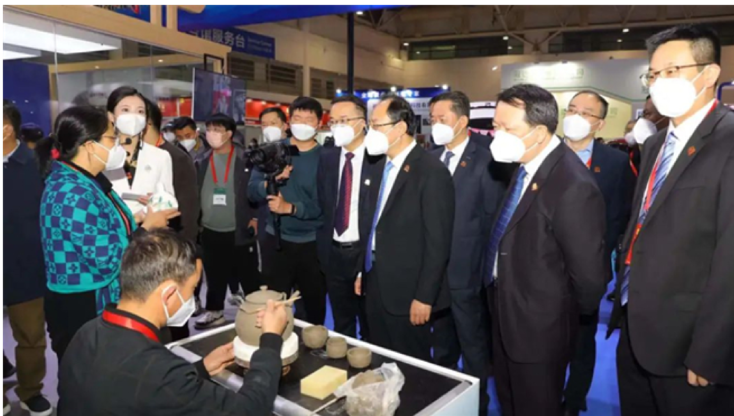
参观文旅福建馆

据了解, 文旅福建馆占地面积720平方米, 设有展位80个, 围绕“清新福建”和“福文化”品牌, 推出了“福见·山海画廊”“福潮·琳琅荟萃”“福茶·香茗雅趣”“福品·至臻匠艺”“福礼·特惠直播”等五大功能展示区, 通过高科技展示手段, 展示“清新福建”“福文化”品牌生态旅游资源及人文特色, 同时注重互动体验, 持续打响“清新福建”品牌, 助力做大做强做优文旅经济。