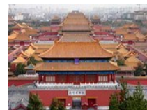
东方古都 魅力北京