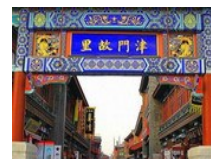
天天乐道 天津有味