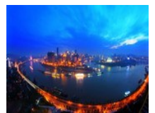
山水之都 美丽重庆