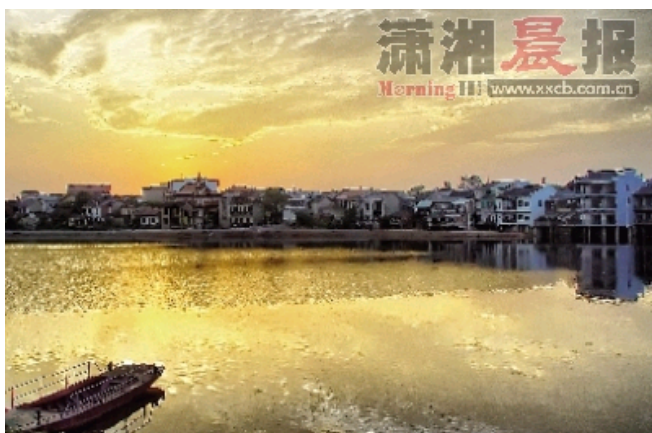
靖港黄昏。

2009年对于湖南省旅游业来说是标志性的一年。这一年，全省接待入境旅游者130.87万人次、国内旅游者15934.16万人次，同比分别增长17.87%、25.28%；实现旅游总收入1099.47亿元，同比增长29.08%。