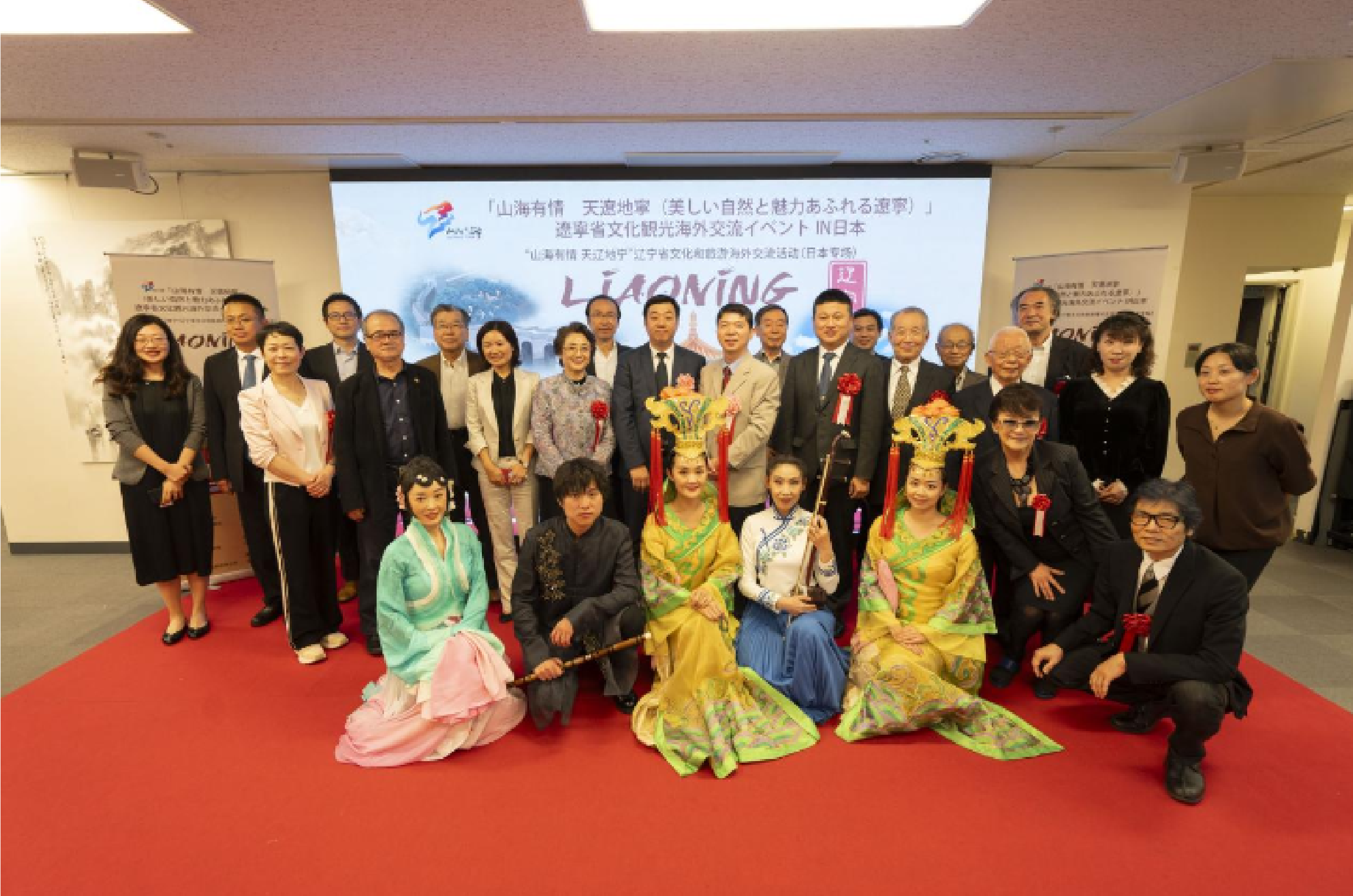
活动嘉宾与文艺工作者合影

日本政府观光局海外推广部副部长桥本佳宪曾长期在沈阳工作，他表示，辽宁浓厚的风土人情令人难忘，希望通过此次活动促进日中两国民众互访。