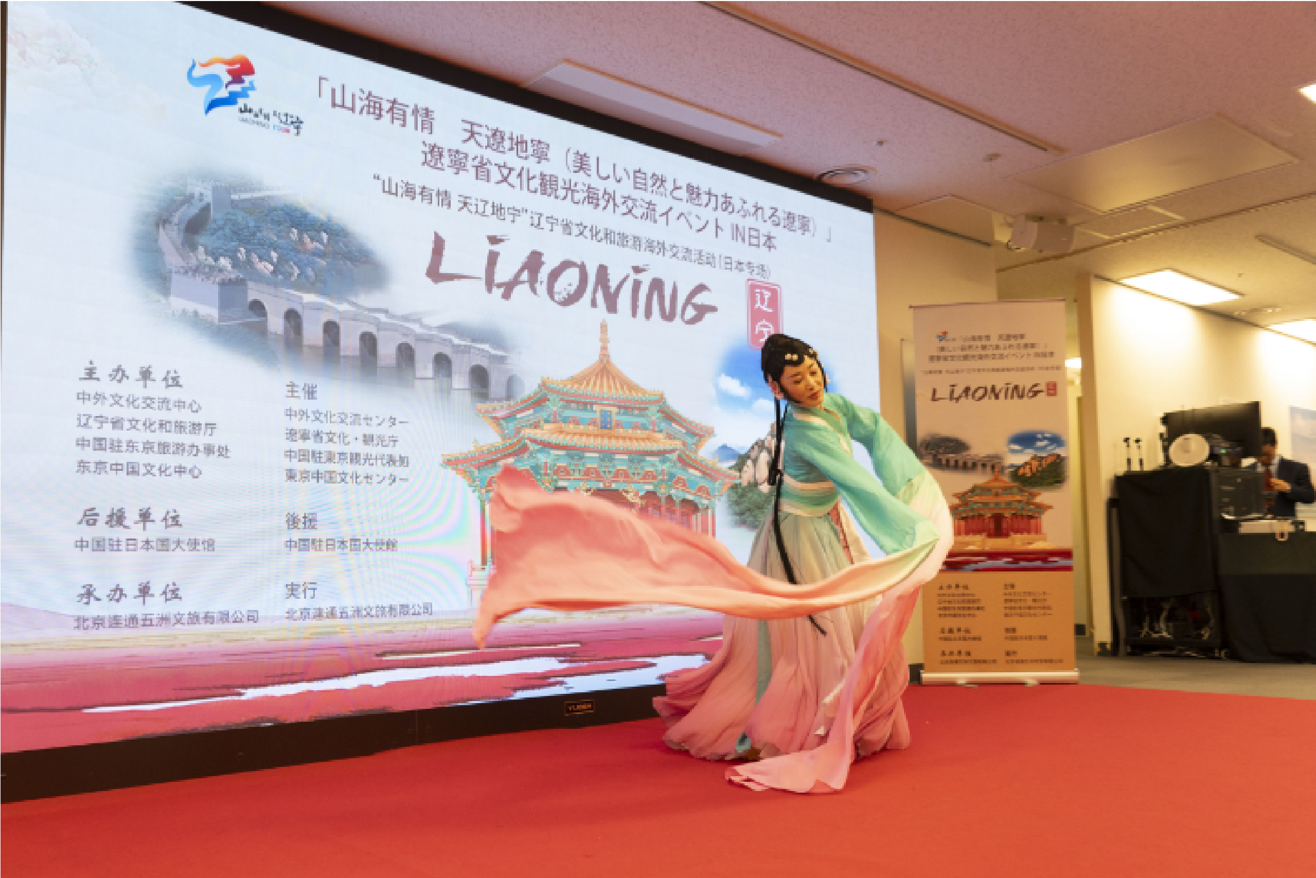
活动现场

中国驻东京旅游办事处主任欧阳安表示，中日互为重要的旅游目的地，办事处将一如既往地发挥好桥梁作用，与日本各界友好人士一道，推动中日深化文化交流、旅游合作，促进中日友好事业健康稳定发展。