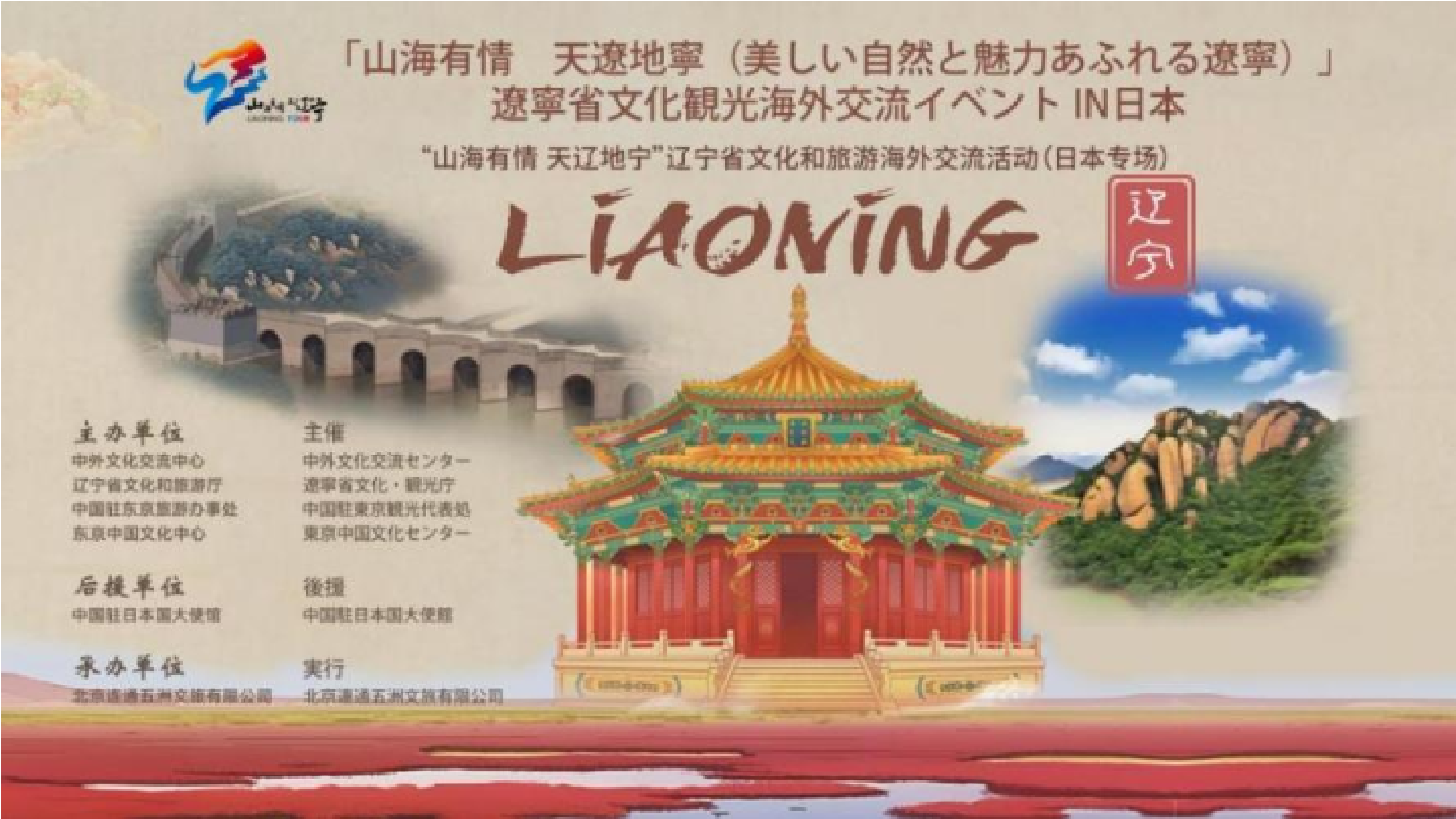
活动海报

10月27日，由中外文化交流中心、辽宁省文化和旅游厅、中国驻东京旅游办事处、东京中国文化中心共同主办，中国驻日本大使馆支持的“山海有情 天辽地宁” 辽宁文化和旅游海外交流活动日本专场在东京举办。