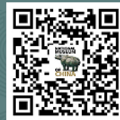
国家博物馆英文版 微信服务号