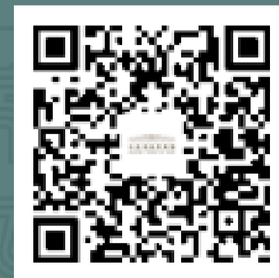
国博君 微信订阅号