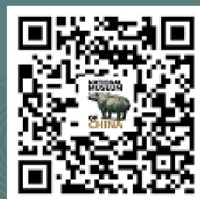
国家博物馆英文版 微信服务号