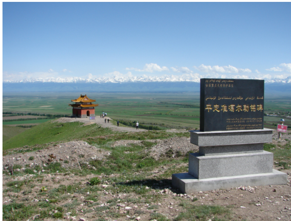
位于新疆昭苏县格登山的清平定准噶尔勒铭碑

最后，朱玉麒教授讲到清代西域的平定与告成天下。清代通过康熙乾三朝的平定，西域基本形成了今天疆域的雏形。清代平定西域最重要的碑是两块，一是乾隆二十年（1755）平定北疆的《平定准噶尔勒铭格登山之碑》，现存于新疆昭苏县格登山，二是乾隆二十四年（1759）平定南疆的《平定回部勒铭伊西库尔淖尔碑》，现存碑座。二碑代表了清代西部疆域的平定。