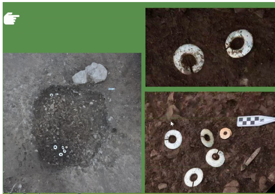
部分玉器出土情况