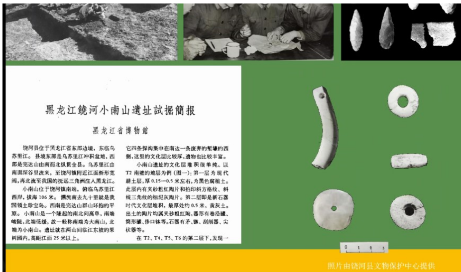
小南山遗址出土玉器类型及数量