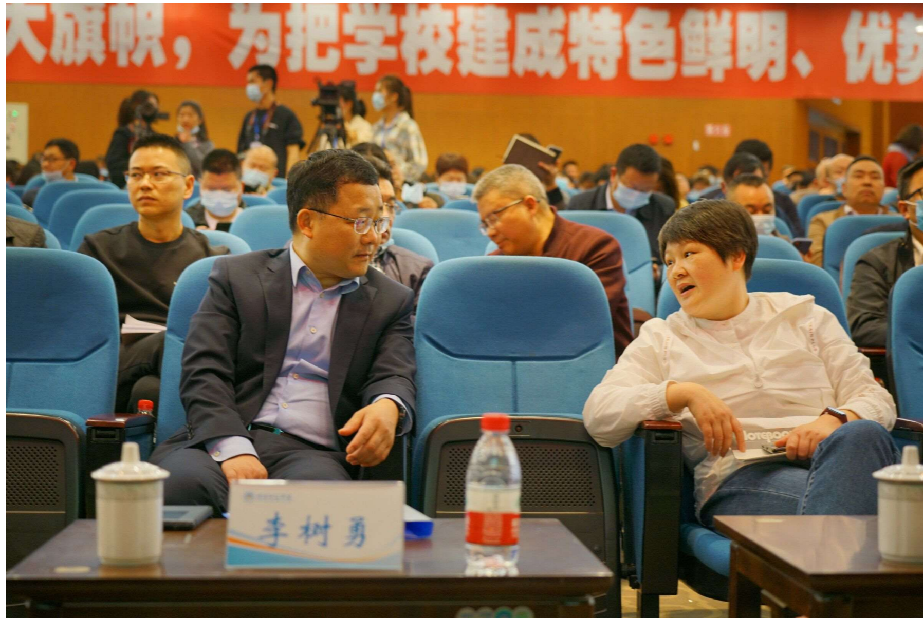
图3 校长书记参加学术研讨会

关于图书馆的人员数量与结构问题，学校高度重视。高校的教学科研、管理服务几支队伍都不可或缺，学校已将图书馆队伍建设提上重要日程，纳入学校人才引进总体安排，通过引进、校内调整增加和优化人员结构，当然，这些人员到岗后，图书馆要严格要求，加强培训、培养，不断提高图书馆管理业务水平和能力，发挥图书馆管理人员的育人作用。