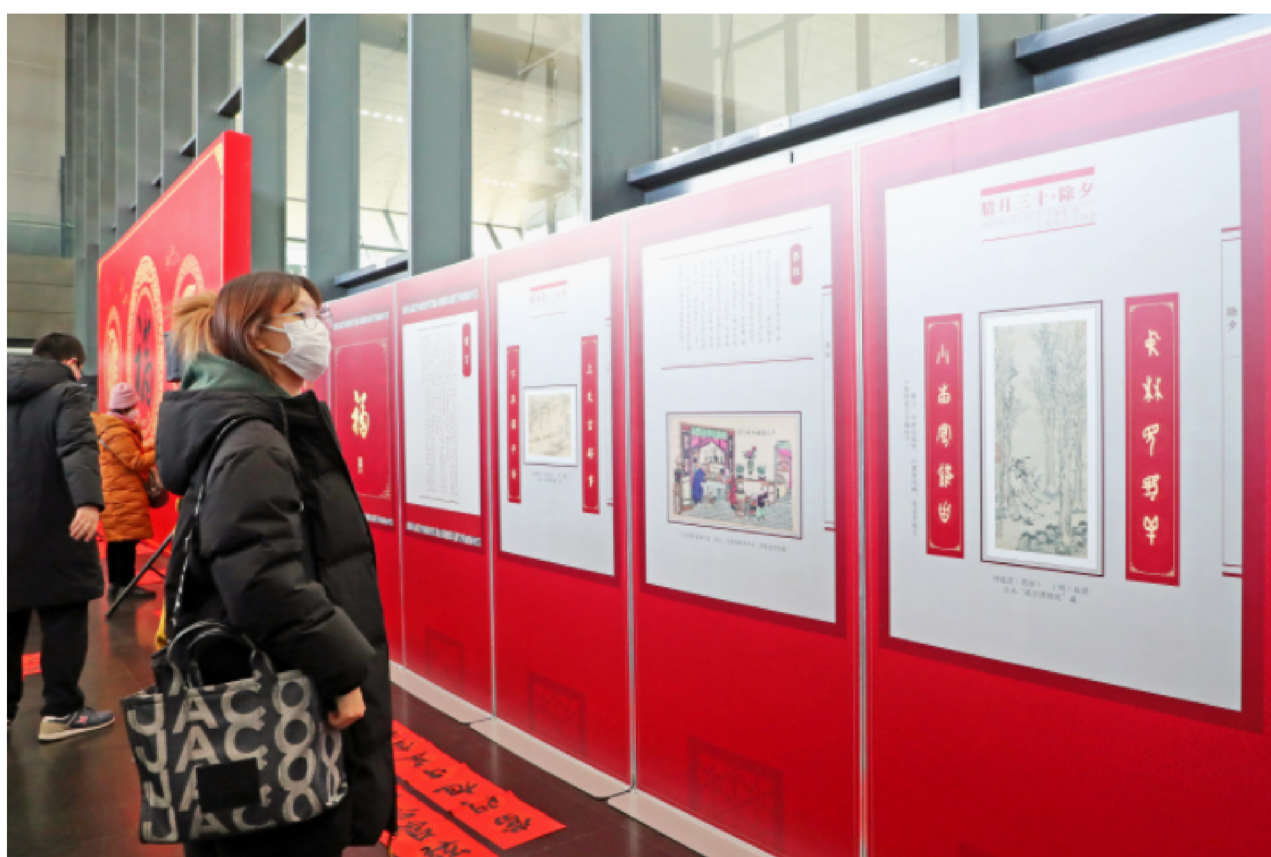
新春典籍文化展现场

春联是中华民族传承数千年的重要年节符号,写春联、贴春联是最鲜明的春节习俗之一,表达了中国百姓辟邪除灾、迎祥纳福的美好愿望。去年,国家图书馆首次举办“古籍里的春联”发布活动,社会反响热烈。今年,国家图书馆古籍专家从14种古籍文献中撷取文辞典雅、寓意美好的春联22副,面向公众发布。22副春联中有出自敦煌文献的“福庆初新,寿禄延长”,有突出中华耕读传统的“鸡声催晓读,鸟语唤春耕”,还有与“癸卯”相关的“癸鼎铸铭百世宝用,卯门启运万物孳生”。