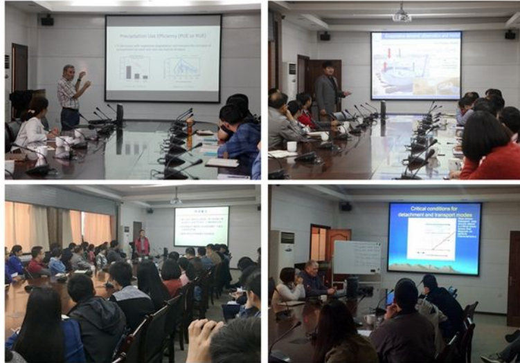
国内外专家作相关报告 (2)

在过去几十年, 经过大规模的生态修复与工程治理, 黄河水沙急剧锐减, 减少幅度超过80%, 针对该问题需构建流域水沙变化集合评估技术, 系统综合考虑上、中、下游的水沙演变特征, 提出黄河水沙调控理论与治理体系。王超院士在报告中指出, 由于农业面源污染的分散性、隐蔽性、随机性、滞后性、不易监测性等特点加大了其控制与治理难度, 因此, 需从根源上发展减源、截留、修复、综合防治处理技术, 并结合长期以来的实践提出污水生态处理技术、面源污染防治技术、氮磷减排技术等, 同时指出未来仍需综合运用工程治理与生态修复技术防治农业农村面源污染物的排放、运移与转化路径。