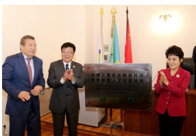
教育部副部长林蕙青考察我校中哈...