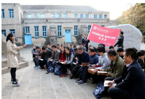
第一期中青年干部专题培训班赴延...