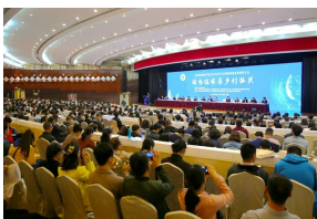
我校承办的中国植保学会201...