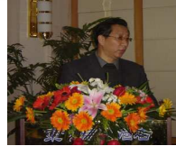
我会参加“促进烟台发展”专题研讨会