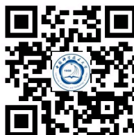
中国科大官方微博