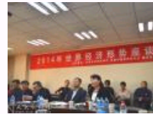
2014年世界经济形势座谈会在人民大学举行