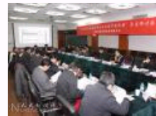
食品安全治理协同创新中心召开“人文社会科学在