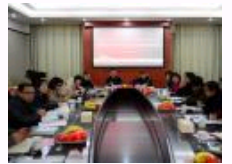
上海市年鉴学会学术研讨会在华东师范大学召开