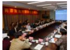
“两岸南海问题研究圆桌会议”在南京大学召开