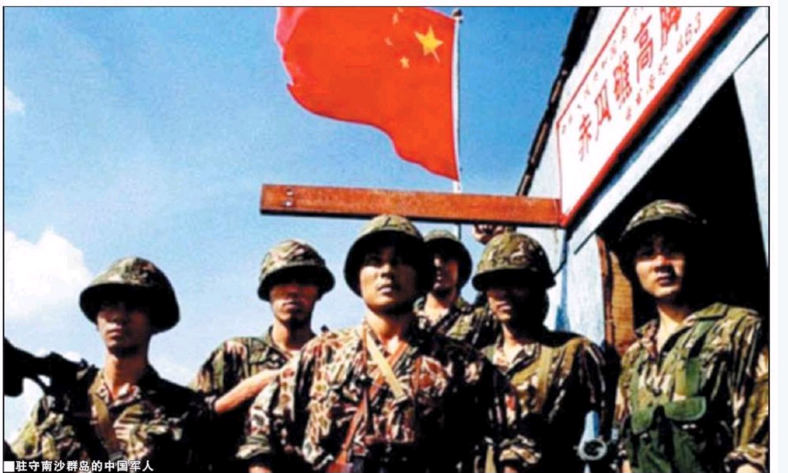
■驻守南沙群岛的中国军人