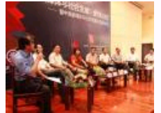
高校及传媒界专家齐聚交大共议“新媒体与社会发