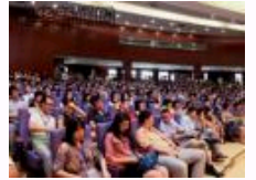
清华举办中国与世界经济论坛 解析当前中国经济