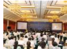
第四届证据理论与科学国际研讨会在京召开