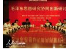
“毛泽东思想研究协同创新”研讨会在京举行