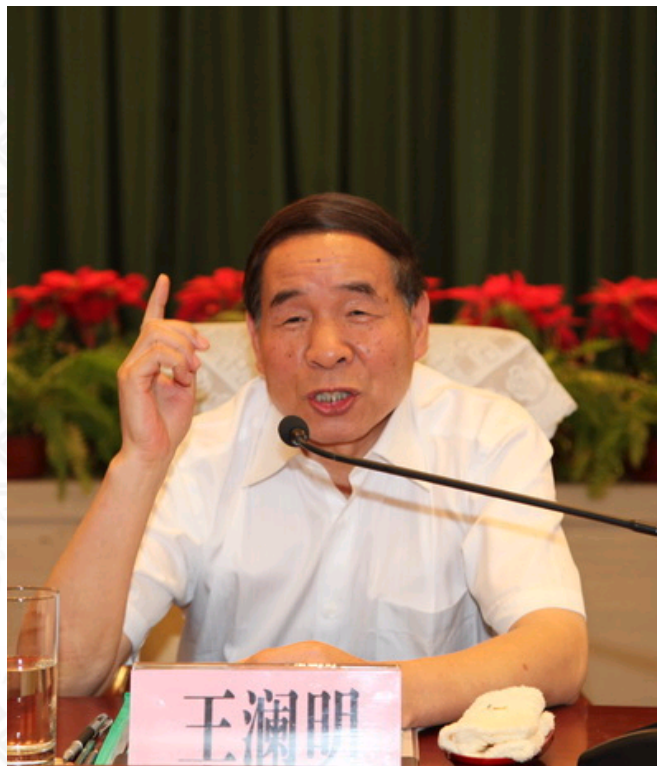
中国行政管理学会会长王澜明讲话