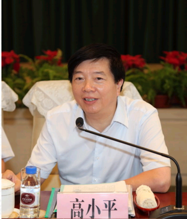
中国行政管理学会执行副会长兼秘书长高小平讲话