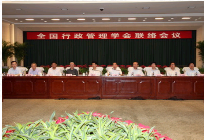
全国行政管理学会联络会议主席台