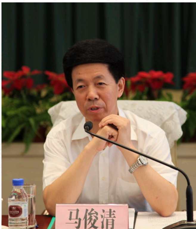
吉林省委常委 副省长马俊清讲话