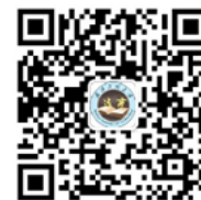
法商学院微信二维码

地址：武汉工程大学流芳校区 邮编：430205 电话：027-87992153 邮箱：xcg@mail.wit.edu.cn