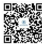
经济管理学院 微信公众号

北京交通大学经济管理学院 School of Economics and Management ,Beijing Jia