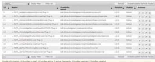
图3 基于Apache Felix Web Console的Bundle动态管理