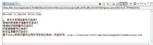
图4 各服务组件的运行状态监控

通过试运行不难发现,OSGi规范及其实现框架为应用系统插件式的体系设计和系统实现提供了标准规范和支撑环境。在该系统中,每个Bundle对应一个独立的应用功能模块,每个Bundle可视为一个组件。应用系统的开发与部署都可以从OSGi所提供的标准规范中受益,从而给系统带来诸多优势,如:每个组件都是独立的,应用代码结构更加规范与合理;每个组件都可以在运行期动态加载与卸载,应用部署更加灵活;每个组件都具有独立的版本号,版本升级、应用规划与管理更加方便;每个组件都具有完善的安全策略,应用系统的整体更加安全。