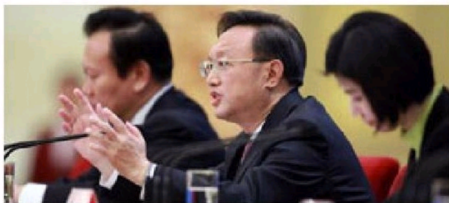
■2012年两会期间,杨洁篪外长就“我国的对外政策和对外关系”问题答记者问。

【核心提示】 目前,中国国际关系研究仍处于理论学习阶段的深化期,尚未进入理论创新阶段。现在大部分国际关系学文章还是在跟踪西方理论,并对其进行阐释,很少有作者提出新的理论假说。