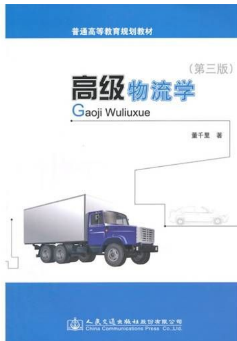
《高级物流学》（第三版）

本书适用于物流管理、物流工程、交通运输、工商管理、国际贸易等专业的本科生、物流工程与管理、交通运输规划与管理等学科研究生教学,也可以用作物流管理专业和行政管理人员的培训教材或参考书。