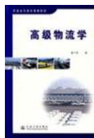
《高级物流学》（第二版）