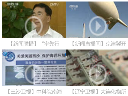
【新闻联播】“率先行” 【新闻直播间】京津冀开 关爱美丽西沙 保护海洋环境 联合国将启动“斯科拉” 【三沙卫视】中科院南海 【辽宁卫视】大连化物所