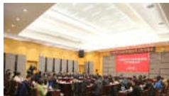
中科院2018年度科技扶贫工