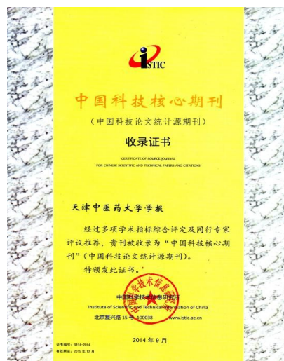
《天津中医药大学学报》中国科技核心期刊收录证书